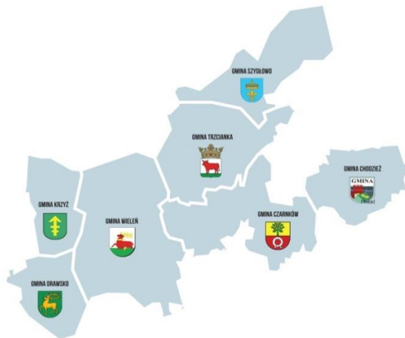
Mapa obszaru NGR

Opracowanie: Agencja Interaktywna Sun Group.